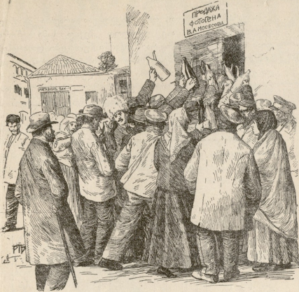
უნაყოფაო ტყულისსა.

„დაიწყო... დიხ, დიდი რამ არის თუ დაიწყო! არ მსურს და არ წამოვიღო, ჩემი ნებაა და არ წამოვიღო“, გაიფიქრა კოლუპნენკომ და იქვე მიბრძანდა ქულის ასაღებად და წელის ნაბიჯით გასწვია ეკლესიასკენ.