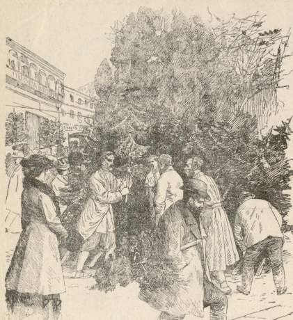
შაბას წინ. —ნასტი როტერისა.