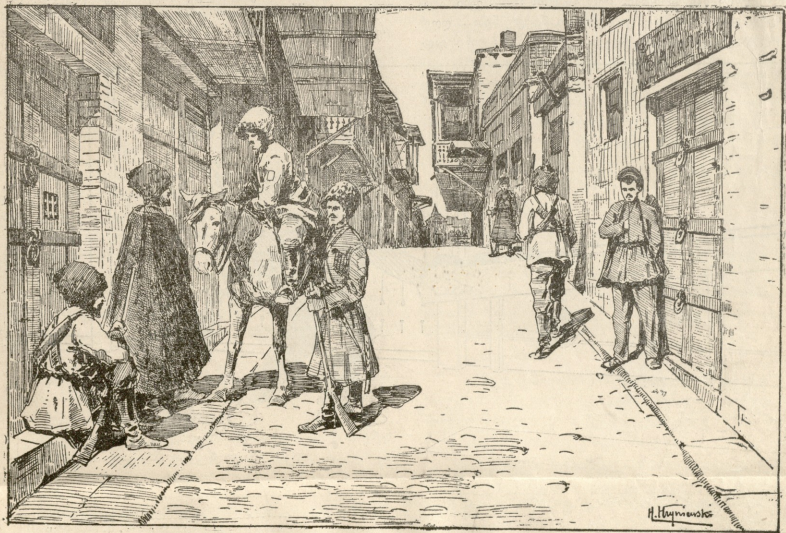
სიამოვნო-თათნო შეტყუება ტყულისსა. —ღარაჯები ვორინგოვის ქჩხაზე. ნასკო ერინგეასი.

„ოჲ, სთქვა კოლუპნენკომ.—სასაღილო თათხში გვეძახიან, იქ ეხლა კოლიო და მიხარული ვამხმარი ხილი იქნება დამზადებული! ეკანომამ მიხარა, რომ ყველაფერი დამზადებული ვაქს! კოლიო წამხდარის თაფლით იქნება შეზავებული და ხილი კიდევ ქია-მატლის გამოხრული. განა სულელი ვარ, რომ მაგისათნა სისძაგლეებს დავეყარო თათისს დღეშიც არა... ჩვენი ეკანომ-ქეციან თხს თითო შეგირდზედ წელიწადში 150 მანეთი გამოარჩენა იქს! ყველაფერი გაგებული მაქს. ბანკში ათასი თუქონითი იქს ფული შენახული... ვიცი ყველაფერი, მაგრამ ჩემდა ვარ: ჩემდა ვარ, იმიტომ რომ სკაი ვიარ. მაშა ინსპექტორი და ეკანომი ერთმანეთში იყუფენ ჩვენს ფულს. ესეც კარგად ვიცი, გაგებული მაქს. მაშ ტუელიოთ ვიფინ ამ თორმეტის წლის განმავლობაში ბურსაკულს ცხოვრებას. დაწერილით მაქს შერტუობილი მავათი ხრიკები. თორმეტეტი“