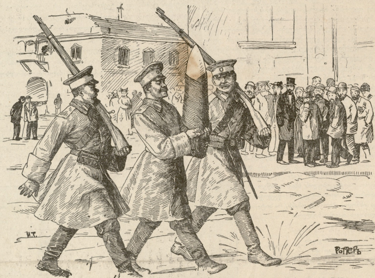
იფიგრების სუიდი შაქარი დაწაფებით შაქეთ, რომ ეზახე არ წაართვან, რადგან ტუელისში შაქრის შამშილია.