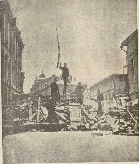
მეგრძელ რაზმების პარაკადა, გამართული დეკემბერში მოსკოვის ერთ ქუჩაზე.

„შორს, საზიზღარო ღემრში!“ — დანგრეულ კლდეებს ზღვა უღრიალეს: