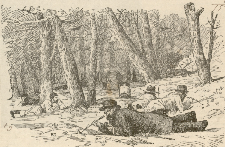
ახლა ისეთი დრო დადგა, რომ უკვლავ უშაშარა მუშტადში წასვლა და იქ სთვესაოდ უთუვლებს ძენა.