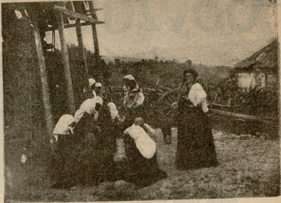
ქალები სხლას წინ.