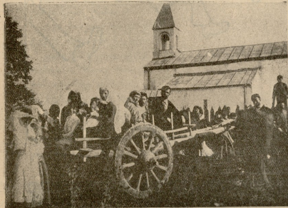
ქობულეთი, გეგლეისიდან მოსვლილი შეკრულების დრო.