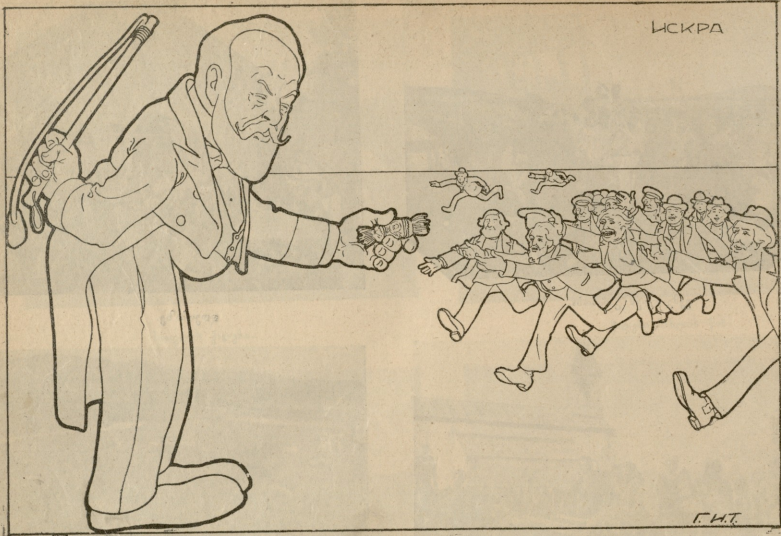
— კანფეტები არა გნებავთ?