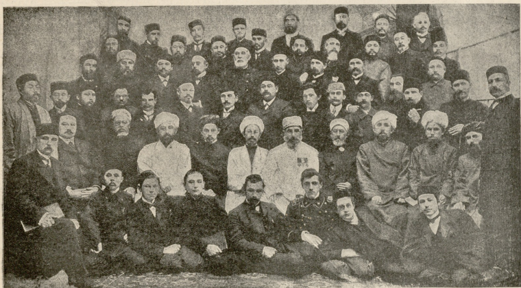
სრულიად რუსეთის მაცქადანთა კრება რუსეთში. — მაცქადანთა დელეგატები.

— ღმერთო ჩემო! — დაუდგვიარს კილოთა მაპასუხა უცნობმა. — იმისთანა პირობებში მოუხეზებლად მიმანია თავის დასხებულება... თუ წნებას მომიკეთ, სხვა დროს გავცნობით,