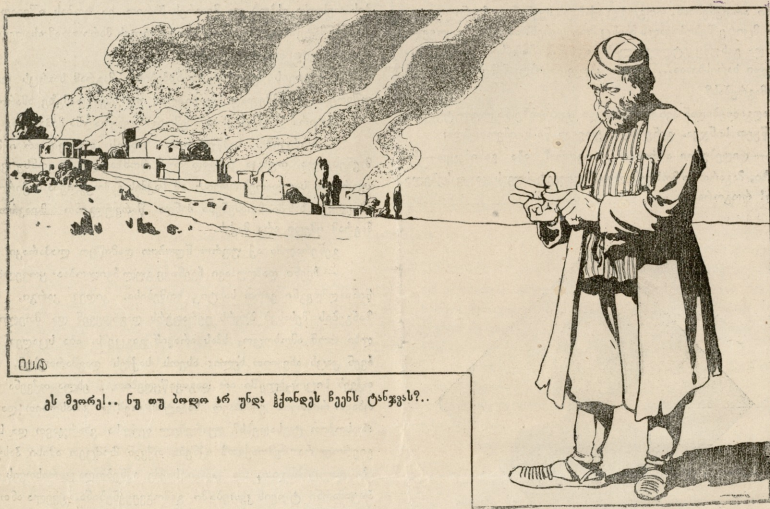
ეს შეორე!.. ნუ თუ ბოლო არ უნდა ჰქონდეს ჩვენს ტანჯვას?..

ვარ, პატროსანი ჯარის-კაცი! ეხლა-კი კმარა... მე სამუშაო მაქვს. დავლიე ქიქაში ჩარჩენილი ამზინდა და წამოვედი. უნდა ვალირიო, რომ შევედრა ასეთ გმირთან კაცის გულში ჰხადებს სიხარულს და ეროვნულ სიამაყეს—ამ ცეკშია განხორციელებული სამშობლოს სულიერი ძალა.