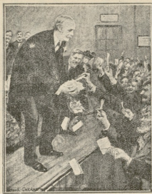
ინგლისის პირველი მინისტრად ნამყოფი ბალდვინი ამომრჩევლების წინაშე... არ ამოირჩიეს!