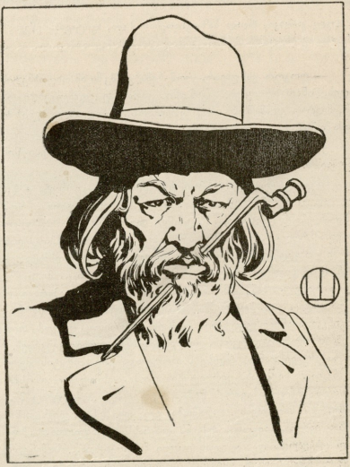
სიტყვის თავისუფლება 17 ოქტომბრის შემდეგ.