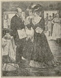
მაცდური ვა საარჩევნო ასპარეზზე.