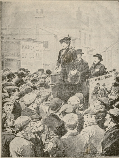
ლედი ვარეჯი, მადლ სასოგადოებას ქალი, ავტორიას ექვემდებარება მისი კანადის სისტემის დასაცავად.

— როგორ ვსულებარ, რომ ჩემს კოშკში ამ თხუთმეტის დღის წინად არ იყავი... კანკანი, ვითამაშე... გაჩვენებდი რა მშვენიერად ვითამაშობდი ისე ვითამაშობ, როგორც პარიზში თამაშობენ... ჰო, ჩემმა მზემ.