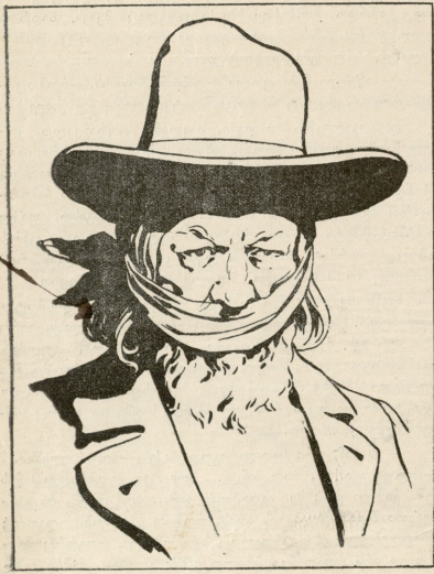
სიტყვის თავისუფლება 17 ოქტომბრამდე.