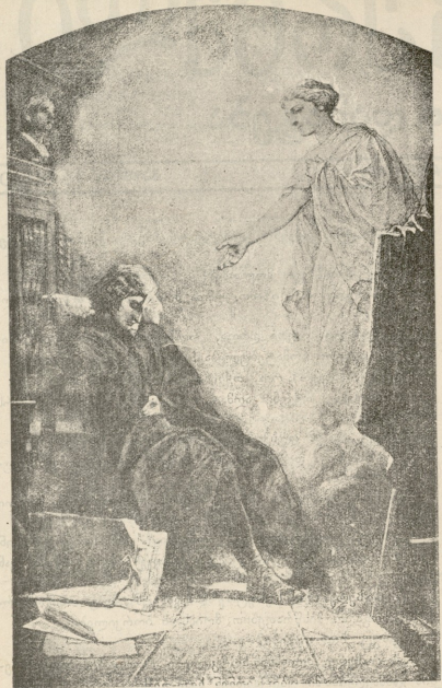
გამომეცე. — სურ. კროტკეანისა

მოსულანს. ეს მართალია, მართალი. შეუძლებელია. მიგაქვს უკან.