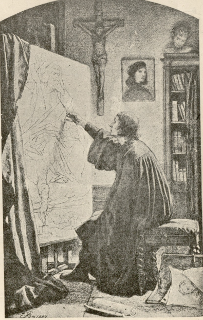
კაენის ძენი! — სურ. გროტგერისა.

კრუტ. და ბზბი (შოღან აყანსტენის ამ დაგვიასკენ, სადგ სდგას საქანს სკამი. მღვანან. Allons en fants de laaaa..