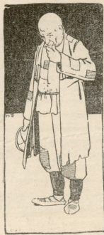
ჩიქაქორ-გამომცემელია ბლ. მ. შახნაძეაბაძე.