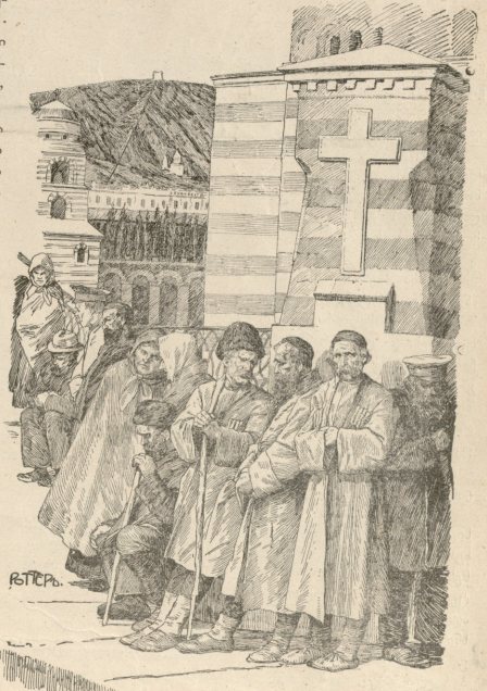
მთხეანელები - ნამუსტინკასა სსახლესთან.

ბოღმა დამწვეულ არწვისაფით ღრღნის ჩვენს გულს, ცხოვრება წვეთ-წვეთად აწვეთებს დარიშხანს ჩვენს ძარღვებში. ვწვევლით ჩვენს შრომას, რადან იგი ჩვენ შვე შუბლსა ხნავს მხოლოდ ტანჯვისა და სიმუწარის დასათესად იმ დროს, რო-