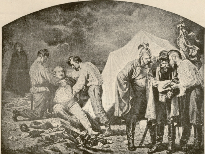
ლალატი და დ. სჯა. — სურ. გროტგუასი.