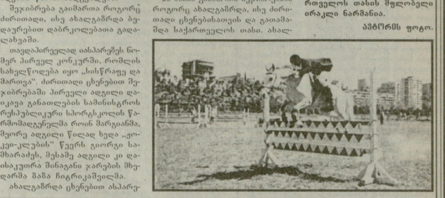
მხედრების მხედრები იბეიშეს.

მხედრების მხედრები იბეიშეს. მხედრების მხედრები იბეიშეს. მხედრების მხედრები იბეიშეს.