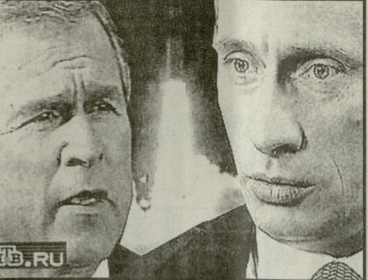
16 0360სა ლუბლიანო (ლუბლიანი) ერთმანეთს პირველად შეხვდნენ ამერიკის პრეზიდენტმა ბილმა კლინტონმა და საქართველოს პრეზიდენტმა ედუარდ შევარდნაძემ...