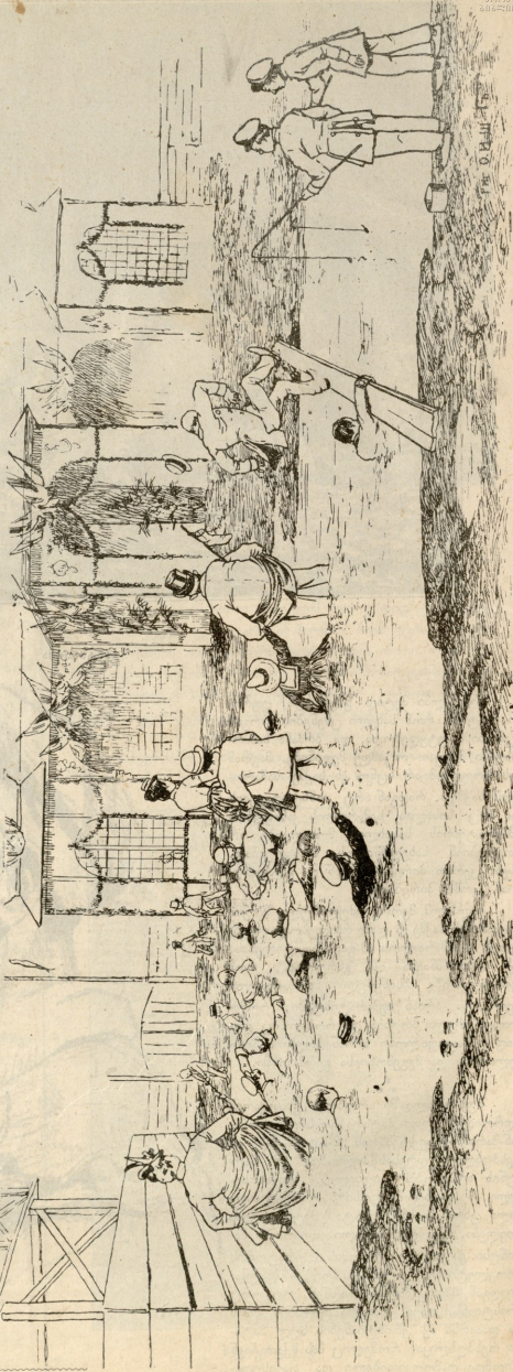
პოეტის შესწავლიან წინააღმდეგობა.

წაქა (გეორგია) წინწარაუღია. წიქა ქინჯარული მოწავეე ბარისახოს, კაცისათ ქრისტიანობის აღმადგენელ საზოგადოების, სკოლისა. ეს პატარა ხეცსური - მოწავეე გეორგინი ტიბია ქართველური სილამაზისა და თან შესანიშნავი მხმარბელი შეიღებ-ღირისა: თამამად ესერის და ახედვრებს ორ კაპიკანს თორმეტი საეენის მანძილზედ.