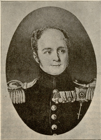
იმენატორი ალექსანდრე ზარევი, რომლის მეფობის დროს მიხდა საქართველის რუსეთთან შეერთება.

ოკი წელიწადი, რაც ივანიკამ დიდის შრომით და ვივაღალხით სკოლა დააარსა ამ სოფელში, თვითონ დღეა მასწავლებლად და სინდისტირად ემსახურება თავის წმინდა მოვალეობას. როგორც შრომის მოყვარე და სამაგალითო მსწავლებლებს, ბევრჯერ მოუწოდებია მოაგრობამ სხვა უკეთეს ადგილზე გადაყვანა, მაგრამ ივანიკა ცოცხლად დგას გადასვლის შესახებ. „თუ გადადგენა ჯილდოა, — ეუბნება იგი მოაგრობას, — ნება მიბოძეთ არ მივიღო ეს ჯილდო და თუ დასჯა, მე