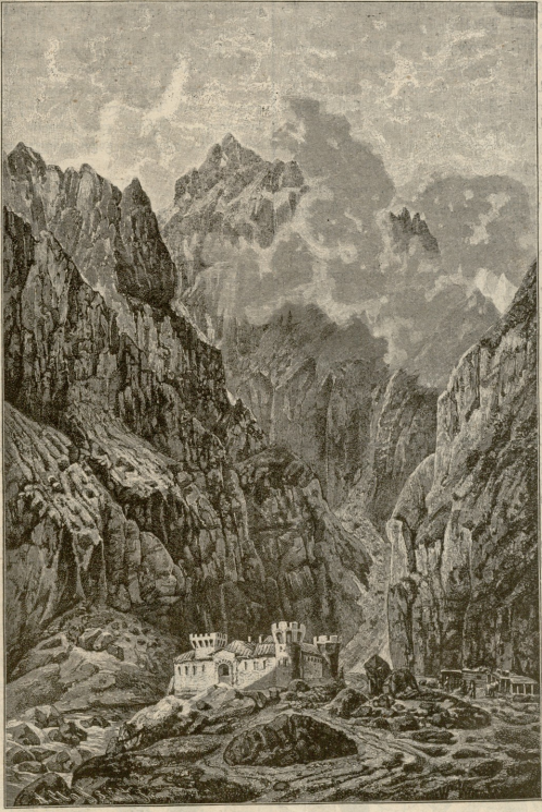
დარბაღის ხეობა