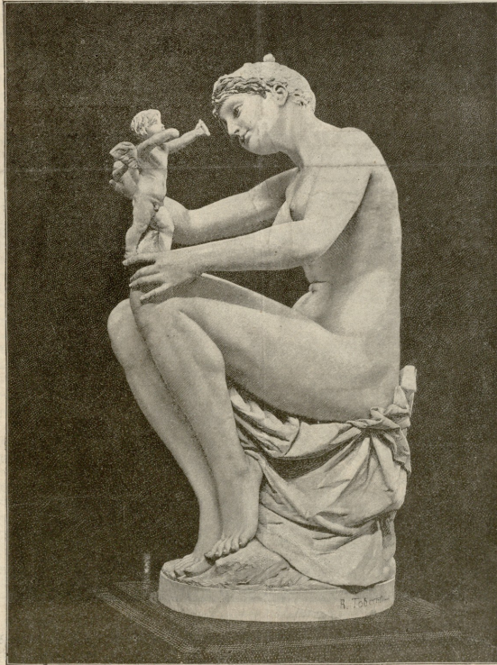
ა ღ უ რ ს ა . — ქანდაკება ტომურენგისა.

უხად საქმე; ფესკემელზეზე, ფორჩეულობაზე ღსხვადასხვა წერილობან საქონელზე ხომ ისეთი მკითე ფასები ჰქონდა გამოცხადებული, რომ მოკიშე ვაჭრები სასოწარკვეთილებით და სიბრაზით გულზე სკდებოდნენ. მაგრამ გარდინგს არავის ვაჭარი არ აწუხებდა! ოლონდ საკუთარი საქმე კარგად წაყვანა, და სხვას თუნდა თავი ჭიხისთვის ეხალა