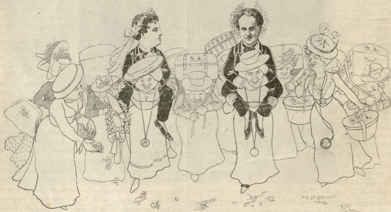
მ. ადელგეიმთა (არტისტები) შემოსვლა ტრევიანისში

როგორც სჩანს ამ ექიმს თვისი სიგონებეში ცოტა ვაშე უჭამა!