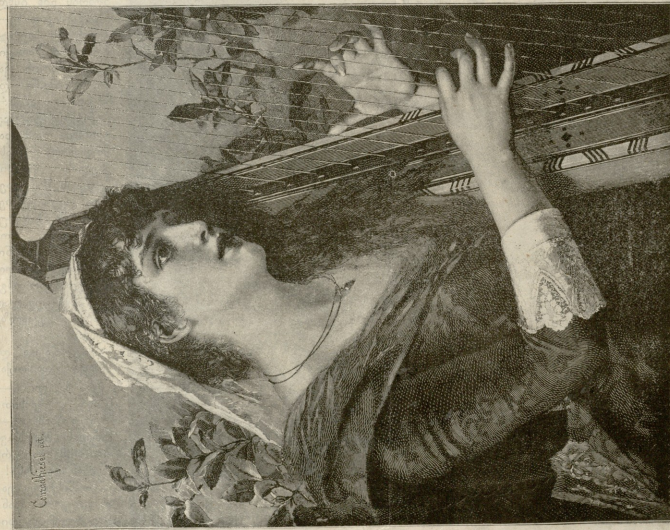
სამპალოს მოტრეფილენი. — მკმა სამამადლო, — რა რე მეცხრან, — სურათი კაქიდას.

და უბედობაც! სარგად იფიქრე, შენი ჭირიჲე, ნუ გავგაუბებ- ლურგებ!