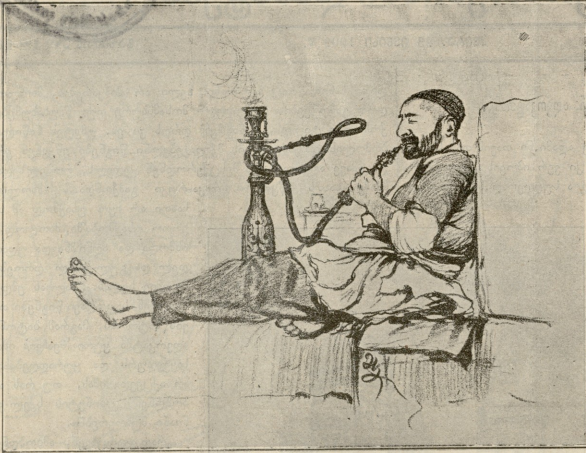
შეჯავშე თათარი მუშაობის შემდეგ

ლი; გადაიხედა მოაჯირიდან სამხარეულოს ღია ფანჯარაში და-ინახა, ვიღაც ბიჭი ეალერსებოდა ახალგაზდა გოგოს.