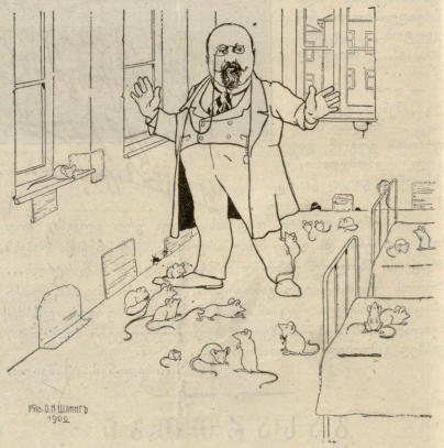
საყავდემოფის ექიმში, ოპ, დმერთო ბენში თითქო ქალაქის არხიტექტორებმა შეეცეთეს ეს შენობა, ფულთი ბგერი დიბაროჯა... მაგრამ ეს თავები რომ მიანი არ მასენენენ?!

გამოცემელი და დრ. რედაქტორი ალ. ჯაბაღარი.