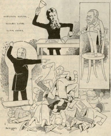
საშუალებას მძიმე საქმის ადგილად გადაწყობის.

ეს რომ შეიტყო გუბერნატორმა, ქვა მიავდო და თავი მიანება თავის განკარგულებას, რთორგ უნდა ეფლოთ სტუდენტებს თატრში—ფეხით, ცხენით თუ აქლებით.