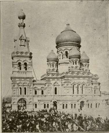
ბათუმი. ახლად აგებული მართლ-მადიდებელთა ტაძარი

— დაწაყველი! ეს რა ამბავია, რომ არავინ მოიღის? გაჯავრდა და უღარი მგარად დააწყრილია ზარი. კიდევ არავინ მოიღის; თითქო ეს, ვისაც ამ