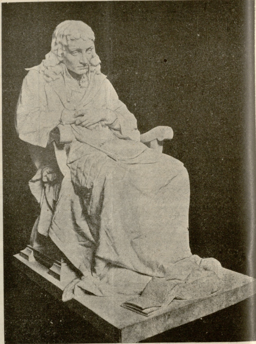
სანაოზა გარდაცვალებას წინ. ქანდაკება ანტოკოლსკისა.