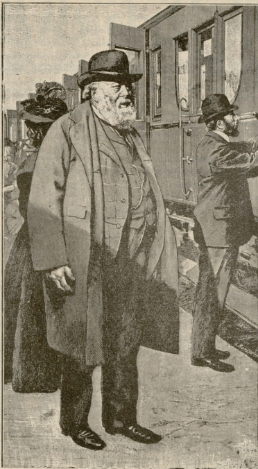
ლორდა სოლსტერა, ინგლისის პირველი მინისტრად ნამყოფი.

რადენიმე იქ მყოფთაგანმა მორათეს ძახილი: ენდარბ! ენდარბ!