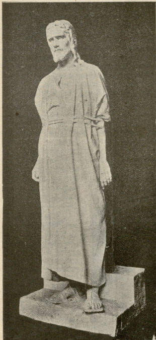
აესო ქრისტე სამსჯავროს წინაშე. ქანდაკება ანტოკოლსკისა.