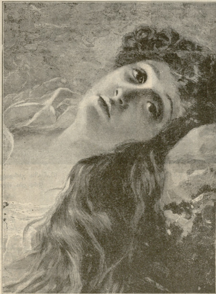
ტკბელ ოცნებაში გაბნულა. — სურათი გრანდას

საკლავი შესახედავი იყო, ხუნსუკავასთ ის რომ შეეცხედით: სახე მოშლილი, მალაღ ოფლში იწურებოდა.