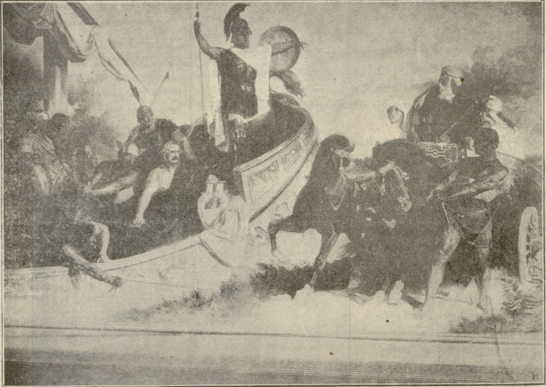
ანგანანტკესა. მისგლდა საქართველოში. — გადაღებულა ტფილისის მუხუჯის კედლიდან.

— მოვარლობა მეწვრილობის ღუბანთან ძეხვი მოიპარა, გაიქცა, ჭეას ფეხი წამოჭრა, წაიქცა და ცხვირპირი დაღვეწა აუხსნა ერთმა მებოკემ.