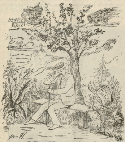
სიზმარი თაგისი მატრონისა.