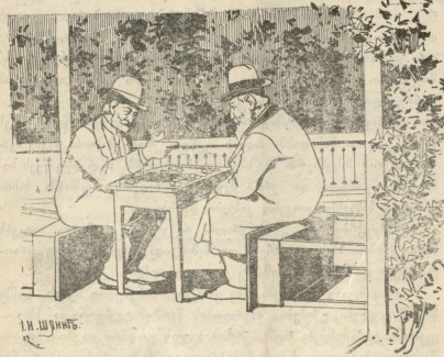
სიმთიანიურა სლამთობი „კორუოკში“. სკაშების უქონლობისა გამო კატაგებული მონარდენი კადამრენებულ სტოლეებზე სსღებან.

— რა წიკნი გიპირაოთ იღღამისი! — თხეზუღებანი გორკისი. — ეს თქვენ გორკისს (რუსულად მწარეს ნიშნავს) კითხულობთ და შე-ვი მართლად მწარე დღე მადგა ჩემი ცოლის ხელში. მთელი დღე ბაზარში მთარუეს.