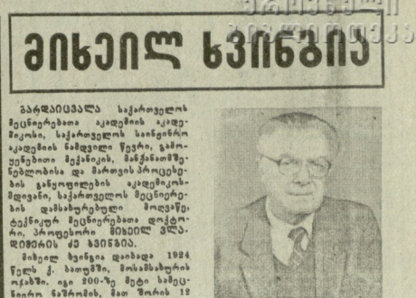
ბარდუღაშვილი საქართველოს მთავრობის წევრია...