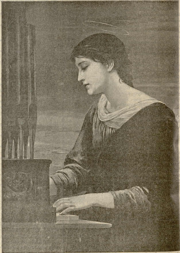
ქმ. ნაგადა. — სურ. კულბასის.

ლება იქნებოდა... ოჰ, სირცხვილო! მერე, თავი ჩემო, გამ- ბედელი? არა, არასოდეს! ან კი რა აზრმა გამოიღვას! — სულ სხვაა — ყოველი დღე უღისა და ნატურაში ვაატარო. დღეს, მივა- ლითად, მოვალეს უცილი, მაგრამ, ესეც კია, რომ იმის ნახვის სულაც არა ვარ მონატრული. მოვალეს არამც თუ უცილი, მეშინიან კიდევ იმის. სულ სხვაა ბიძია... ეჰ, კაცი არ უნ- და შეუდგეს ჩხრეკას, არ უნდა გამოუდგეს ადამიანის გრამო- ბის წერილობანებს კაცის გული ვაუგებარი ზღვათა, სთქვა მგანი ვილდ დღმა მწერალმა. ჩემთვის სულ ერთია, დღე, თუნდა ათი წელიწადი იცხოვროს! შეუძლიან კი გამამდიდროს კარზე მომგვარ წლის განმავლობაში. ასე იქნება თუ ისე, იმოქმედ ახალი წელიწადი, როგორც შენი ქვეუ და გონება გასკრის! სავსებით გენდობი: რასაც შენ გააკეთებ, ალბად ღვთის