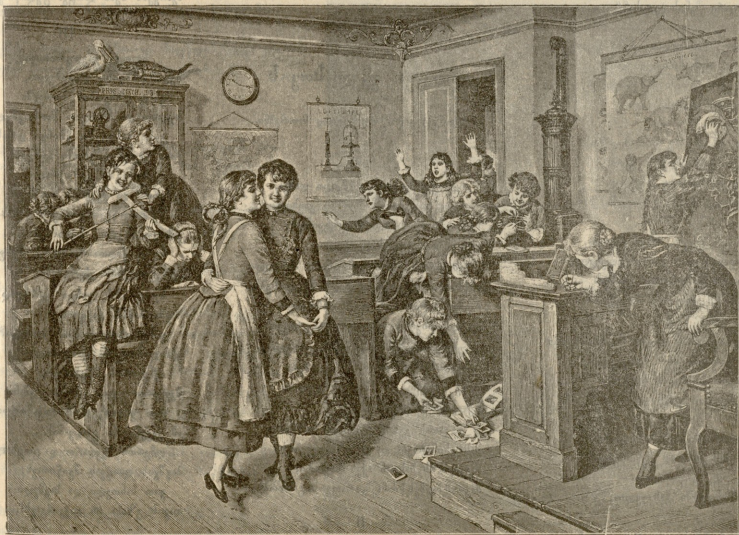
უქმე დღეები ზანსიონში. — სურ. სხივების.