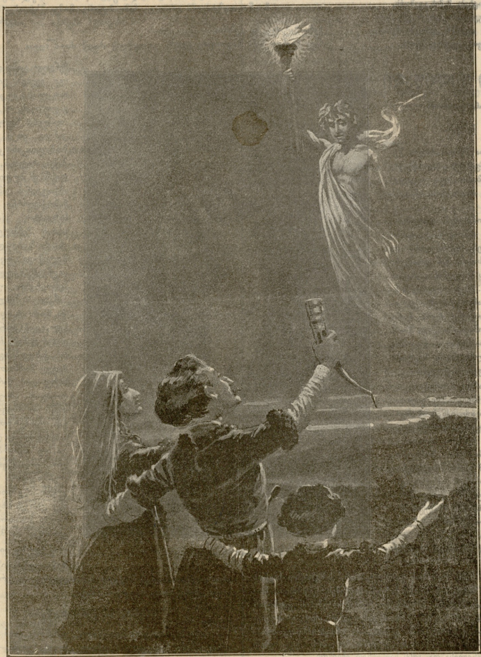
მშვიდობა მოსვლასა შენსა! — კარნაშით ნახტი ო. შერდინგის.