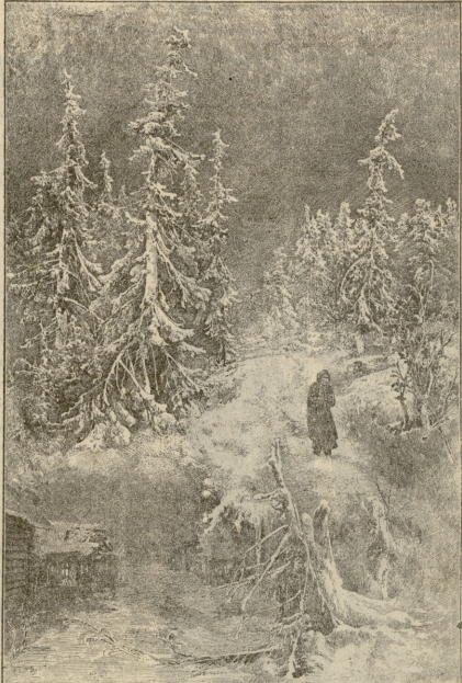
სანადგურო.