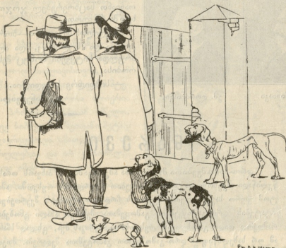
რ. ი. შამიტა