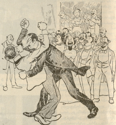
რ. ი. შამიტა 1902