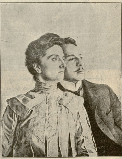
საკსიანაის კრან-პრანცეს ლუიზა და ეირანა.

— ბედნიერება მოგვენიჭე, ძმებო! — სთქვა ყველაზე უშრომისა ერემიამ. იგი იყო მალალოს, ჩასუქებულის ტანის, მკურარა სახის გამომეტყველების პალორა კაცი. — ელთა თამაზად შევიძლიან ვადავადგათო ჩვენი სამარცხინო ხელობა და სხვა რამე კარგს მოვეკლათ ხელი. რომ გორ ჰქვიკობათ, მეგობრებო! — მიტბრუნდა აშანავებს. — ჩვენი სიბარული უნდა ვიდღესასწაულად და ერთხელ მაინც ჩვენს სიკაცხლემში მივეგებოთ, რო-