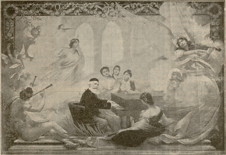
ქუნოსთან. — სურათი ფანტაზია დიუმბუფისა.