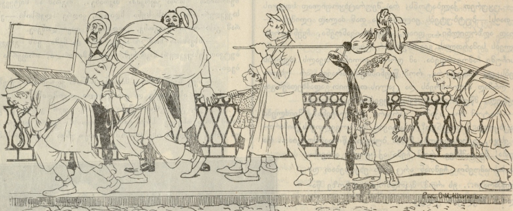
რამდენად უხერხულია ტფილისის ტროტურებზე სიარული.