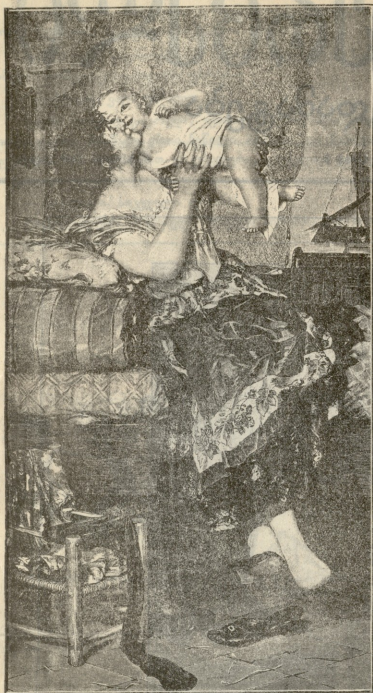
ზარეკლა შედაა.—სურათი, ფეჩავისი.