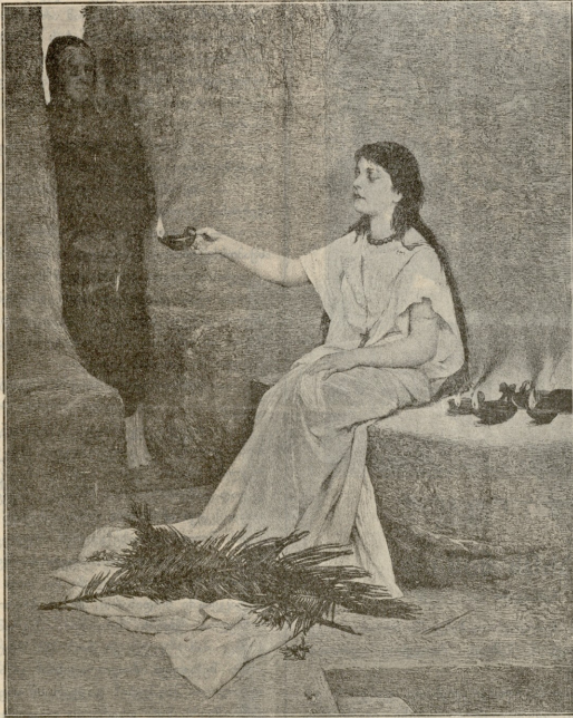
თვალ-უხილველი სინათლე ურბებს.—სურათი ჭოღიაშვილისა.