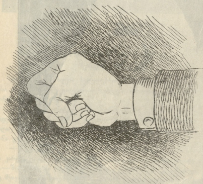
ახლანდელი იარაღი საქმეების გადასწვევტად.