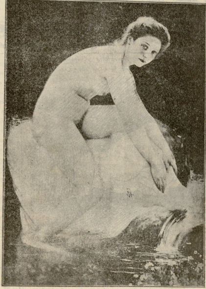
ხომ არავინ მსჯედვს! — სურათი გერტუსის.

— ჰო, გუნჯვალის შენი მარინე, ვერ ვილდე განვართობ. სინამ მოვანებებ სხვა რამ განართობ! — კვერ დაურა მარინემ და თანვე თავადები ისე ათამაშე, თითქო ბუნდა უთქვა: „არას მიმეხვდება“