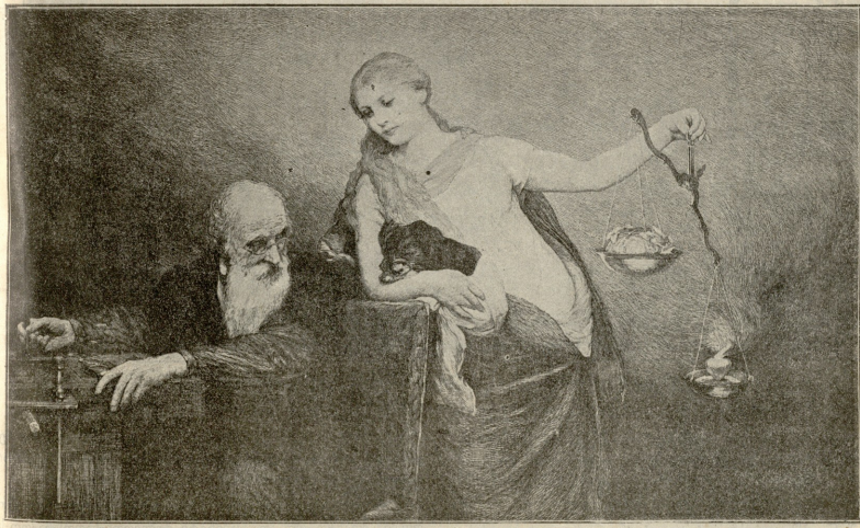
გული სძლეეს ტვისს.—სურათი ჰოლგაფელისა.

—ღამეზიკა და ნასწავლიც, მაშ! —ყელის მოდერებით უპასუხა მართამ. ქალებმა მაშინები გააჩრეს. ოთახში სინემე ჩამოვარდა. მართა საკერავეების შრიალი არღვევდა ყრუ მღუმარებას.