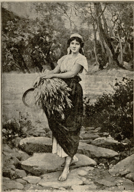
მანანა, — სურათი ჰეგიაშის

ამ საერთო სიხარულმა და გატაცებამ მია ივანეს გული უფრო დაუბურა; ეხლა უფრო გარკვევით, ცხადად გაითვალისწინა სიმატოვე, სიბოლღე გულისა და სიმწარით იგრძინო რა ძნელი აუტანელი ყოფილა იგი. გული მტკივნეულად შეეკუმ-