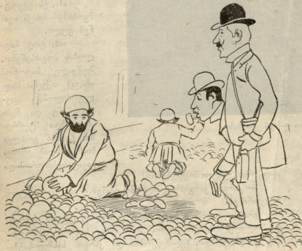
ბაგამანელი სურათები ტფილისში

— ზენსის, როგორ გეხონა, ქუჩის ამ გუგად დაფნა რომელ სუკუნებში იგოდნენ? — ზეგონია შეუთრამეტე თუ შეთორმეტე სუკუნებში.