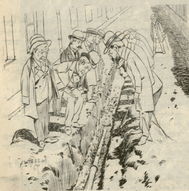
ქუთაისის წელსავეხის „აიაშვიკი“ იკვლევენ, თუ სად და რამე დახსრავა იმათი ფული.