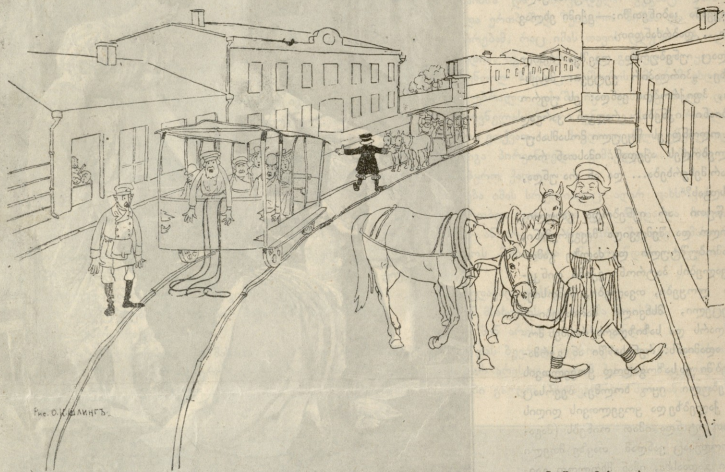
ტრავის უსახელო საზოგადოებას ხშირად მეფურცესს ცხენები უხვით ვაგონებში, ამისთვის ნუ გაკაცობდებათ ამგვარ სურათის ნახვა.