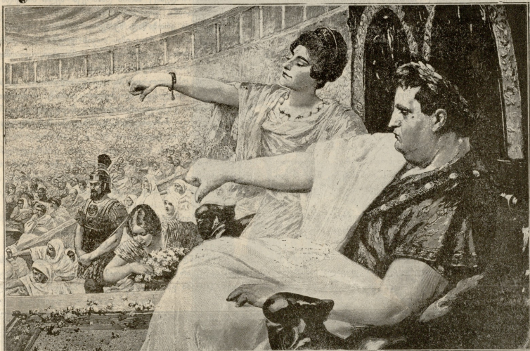
ნერანი ცირკში.—სურათი ზეტერსისა