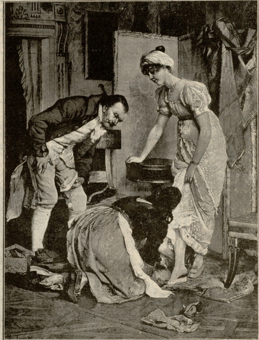
მკექვე. — სურათი გივისა.

— არ გირჩევთ მეც კბილის დაბლომებას, ეგ კბილი, სულ ერთია, არავითარ სარგებლობას არ მოგიტანთ. ერთ ხანს კიდევ ამხატუნება ფულუროიან კბილში პატარა