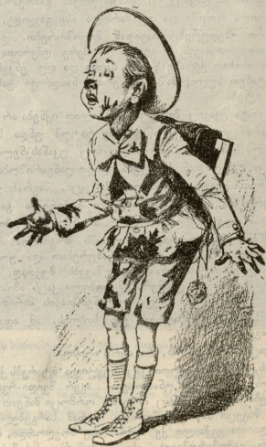
— დედა, დედა, დღეს შირეული ბაგუთილი წერა გეგონდა.