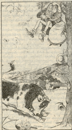
— შირთაღია, უღუნე, აქ უშეშვარბა ვართ, შერამ ქვეით უფრო ბუღინურად და კარგად ვერსობდით უნა.