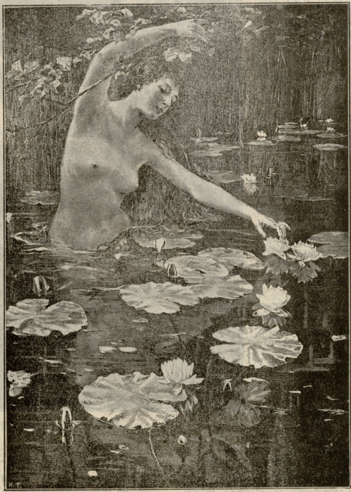
ტობის გაწვება.—სურათი ბრეტის.