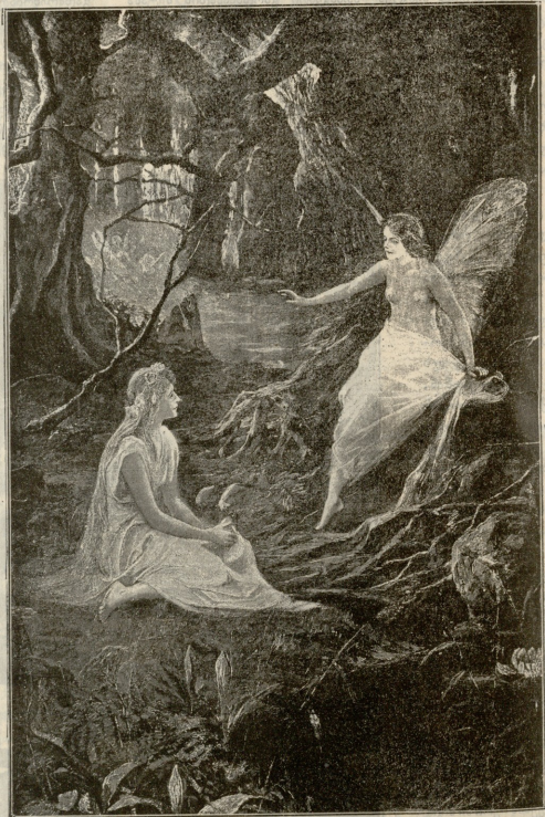
სასამაგნო მახარბეული — სურათი მორგისვის.

— აწი და მე რა დავიშვე? რა ერთი თუნებნი ვებარჯვის ჩემზე? ერთი ძველი ნაკბევი მიღია, სახლშიაც ამით დავი-