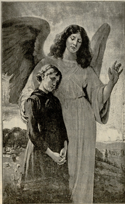
სურათების მკვეთელი.—სურათი დინგერისა

რაც სიკიცხლე, თუ უმნიშვნელოდ ბეჭელასავით იფრენს, გაქტრება, თუ ვითა ყვეილს, ველზედ გადაშლილს, მოსწავებ და მერე ხელოში დასკნება? მე იმედი მაქვს, ერთბელაც არის მღვა იელეებს, ცა დაიქუბებს