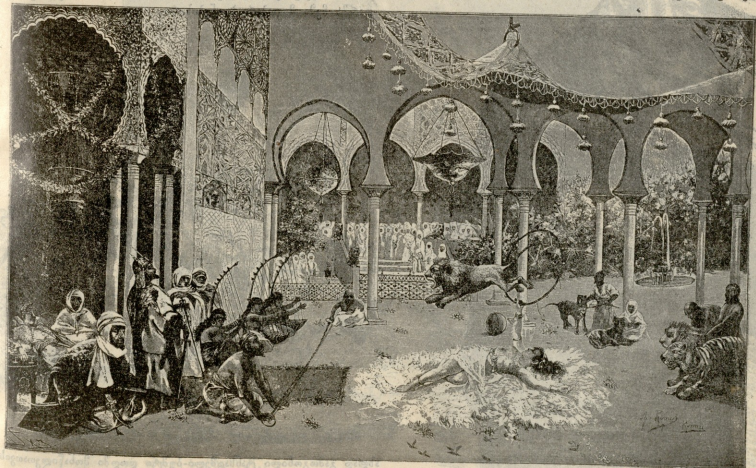
სადღესსაწაულა წარმოადგენს პაღმბარას მუფის სასახლეში. — სურათი რივისის.

ბევრი რამ მასწავლა იმან, რასაც ვერ იპოვნი ბრძენთაგან დაწერილს სტელს წიგნებში, რადგან ცხოვრების