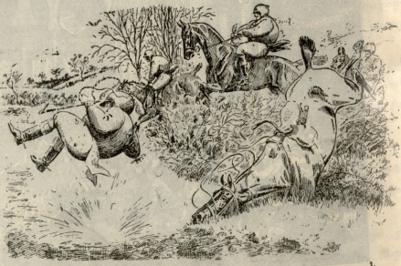
ახლად გამოტონილი ტანსაცმელი-ბუშტი დღეში მონაწილეუთაის.

— რა ამბავია უფრო შეგისხვევია? — სურათების გამოფენაზე ვიყავი, ისეთი საძაგლობა იყო, რომ ბევრი თავის ქნვეით ვისვრი ამტკავდა.