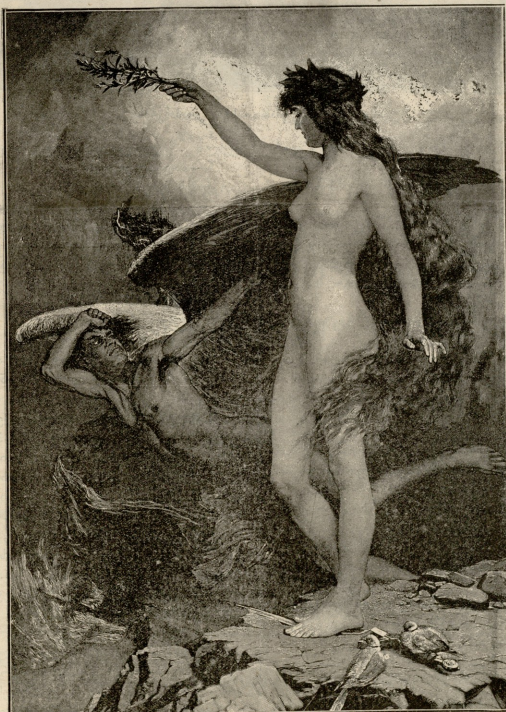
დაკომარნაეუ მშვიდაბანობას! — სურათი პეტლერისა.

— გავარი გიწერია, მარინე! — წარმოსთქვა შემოსულმა ბოლოს.