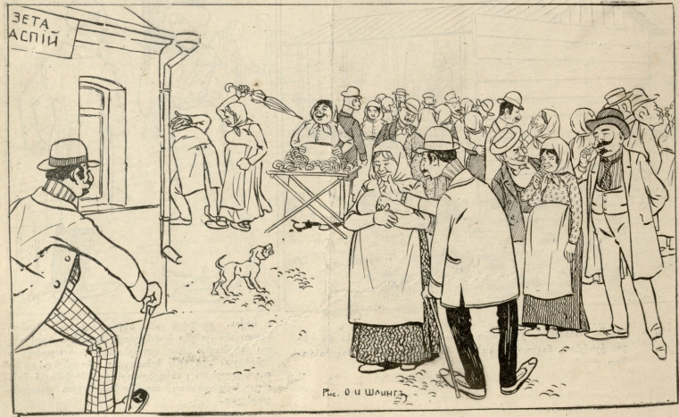
რეს. D. H. ШАНГ