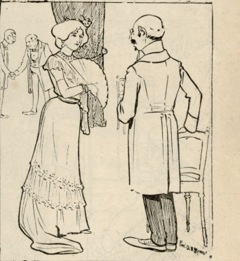
ბაქია. ხელვაში მობანავით შეუქლიანთ „დასტკენენ“ სახამაროას და ნსკვის ქერქები, ნავგასა და ტუქვიან ნათვის ზილით და შიგ ბანაობით.