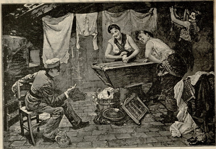
მხარულა სტუქმარა — სურ. კლამპნისია.

ზოდა და ტრეკელა ფეხები წვივებამდის უჩანდა. მარინე აგერ შვილი თვის ორსული იყო.