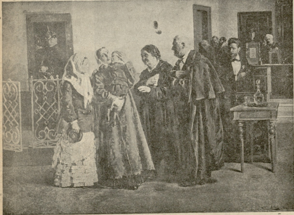
სახანართლომ გამაბროლო.—სურათი შავოესკისა.

მარტონა. კარგი, ჩაუტყვი! დაიფიცო? აიცი: ჩაუტყვი. მარტონა. (თითო-თითოდ ვარდს ფოთაფებს ეღვევს და მანი აწმქნის—ჰო, არა?)