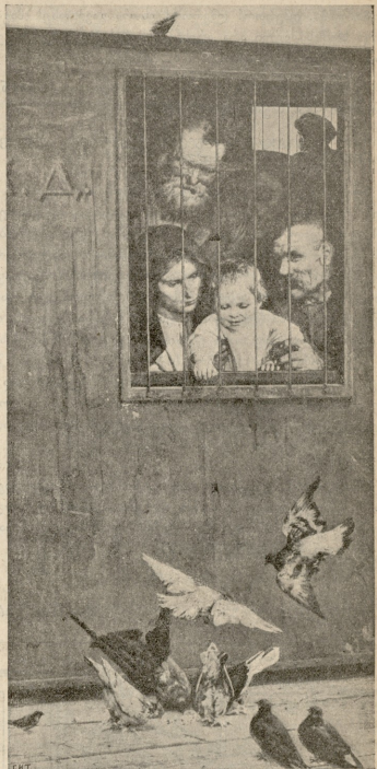
ყველან სიცოცხლე.—სურათი ანოშენკისა.

მარუჩა. (აღღებებულ) მამაო! მასწავლე, რა მოვიქმელო თუმცა დღეს თითქმის პირველად გხედავ, მაგრამ ვგრძნობ, რომ შენ დიდი ხარ, მძლავრი ადამიანი! გული მეუბნება ვნებ დავიგოფდი და ისე მოგთხოვო—მასწავლე, რა მოვი-