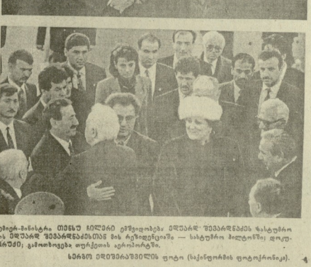
საქართველო-თურქეთი: კეთილგუზოკობა! (Caption describing the images)