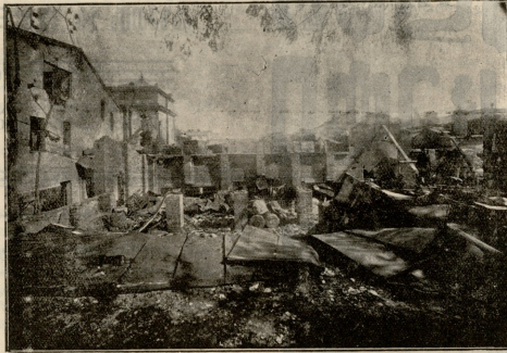
დამწვარ თეატრის ტ. თვ. ა. წ. ქარვასლის ნანგრევები ბაღის მხრივ.

ვახტანგი. არჩილებივით დიდხარ, თვალბში შემოძკერით, თითქოს გინდათ ჩემი დაფარული ახრები ვაგიოთ. ნუკაც კი, პატარა ნუცა, რომელიც ჯერ ისევ ტრინებით უნდა ერთობოდეს, ჩემს დანახვაზე ჰკითხება და მუხლებს. არაჩვეულებრივს რასა ჰხედს ჩემში?