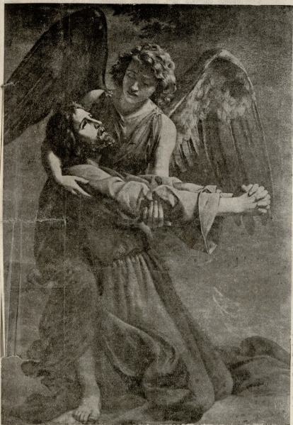
ქრისტე გეთხიზნის ბაღში. — ნახატი მეტრის.