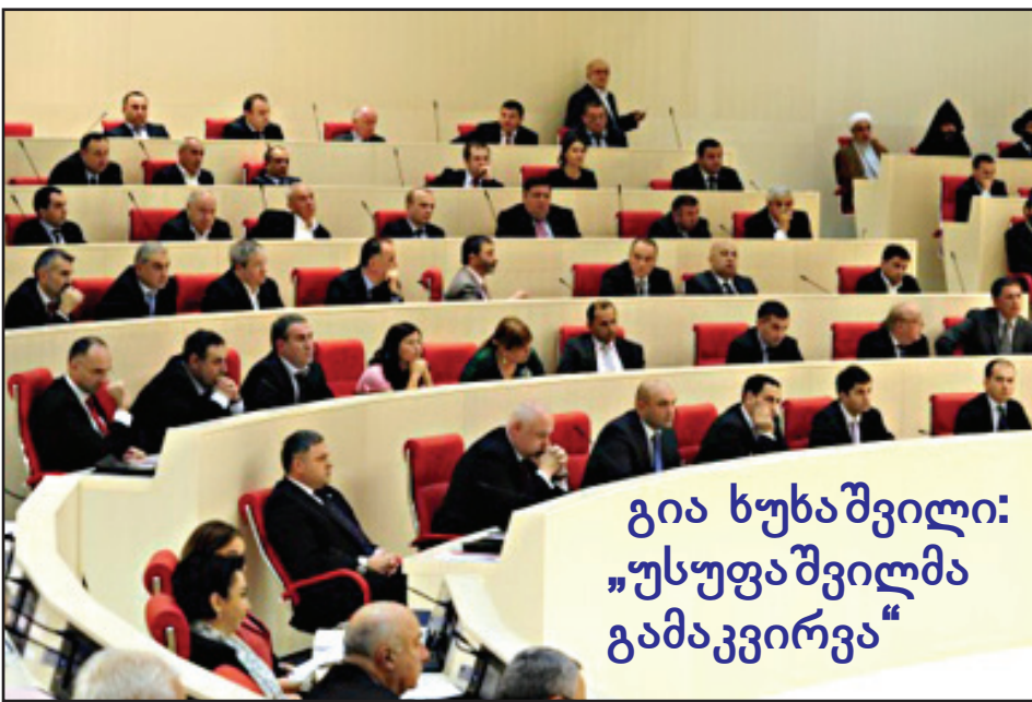
გია ხუბაშვილი: „უსუფაშვილმა გამაკვირვა“

„ჯერ იყო და გამსახურდია-კიტოვანი დაუპირისპირდნენ ერთმანეთს, მერე შევარდნაძე და ასლან აბაშიძე გახდნენ ერთმანეთის ოპონენტები. შემდეგ იყო შევარდნაძე-სააკაშვილის დაპირისპირება.“