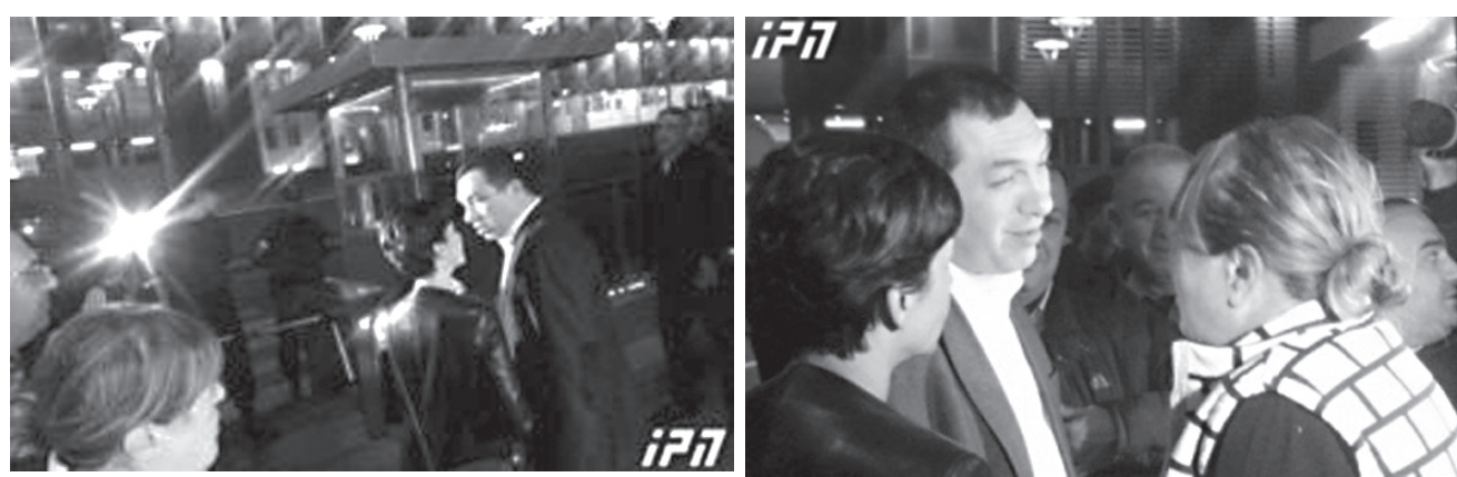
„ბიძინა ივანიშვილი ძალიან ცუდად დაამთავრებს“

დათ? – სიცხადე ყოველთვის კარგია. ეს სიცხადე დაგვემარება ქვეყნიდან ბიძინა ივანიშვილის გაძევებაში, – განაცხადა თამარ ჩერგოლეიშვილმა.