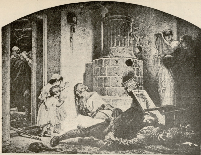
ადამიანები თუ მხეცები! — სურ. კრატკერის.

უსპობდა მოგებას. კაპიტალისტები განცვივრებით ერთმანეთს მკითხებოდნენ: