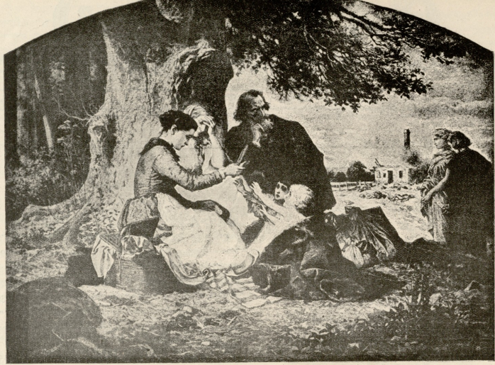
შიშლილი — სურათი კრატკერასი.

ლი ხალხი და თვით კაპიტალისტების მსახურნიც იმ მიდორდნენ წყლის სასყიდლად.