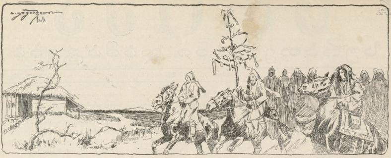
სამეგრელო. —საქარდად მიმავალი მეგრელები.

არა ამ ქუჩაში მთხინვე შეამჩნიეს მარჯვნივ ვეგერბთელა, სამ-სართულიანი სახლი; ეს იყო „სახალხო სახლი“, რომლის სახურავზედაც წითელი დროშა ფრიალებდა.