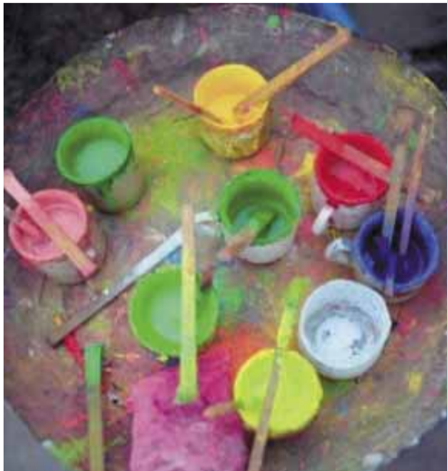
ფერი აგრესიას აცხრობს, სიმყუდროვისა და სიმშვიდის შეგრძნებას ბადებს: ტყუილად კი არ უნოდებენ კარგ ცხოვრებას ვარდისფერ ცხოვრებას.

თუ იმით იტანჯებით, რომ მოდუნება არ შეგიძლიათ, საძინებლის ფერი შეცვალეთ, კედლები ფლამინგოს ან ატმისფრად შეღებეთ. თუმცა უფრო იაფი და მარტივი გზაც არსებობს - შეიძინეთ იმავე ფერის ლამის სამოსი ან საწოლის თეთრეული. მეცნიერულად დამტკიცებულია, რომ ვარდის-