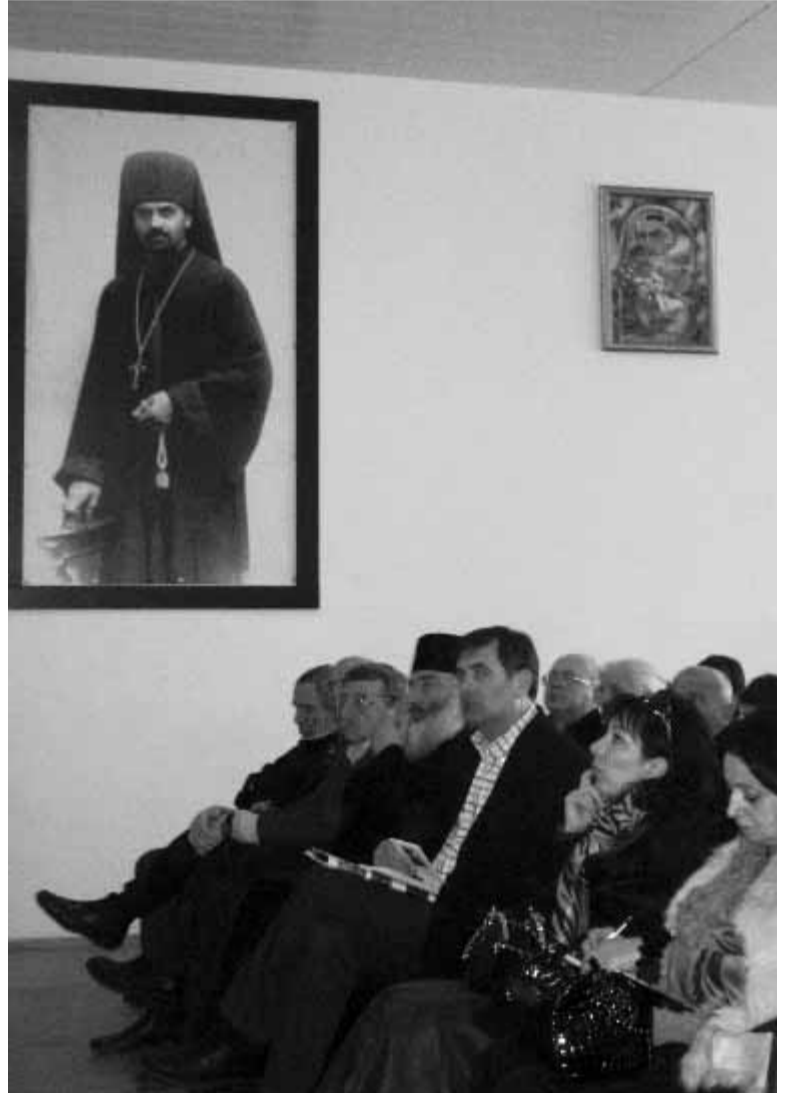
ძელოთ ურთიერთობა, რითაც ხელს შევუწყობთ წმიდა გრიგოლ ფერაძის წარმოჩენას საქართველოს საკეთილდღეოდ.