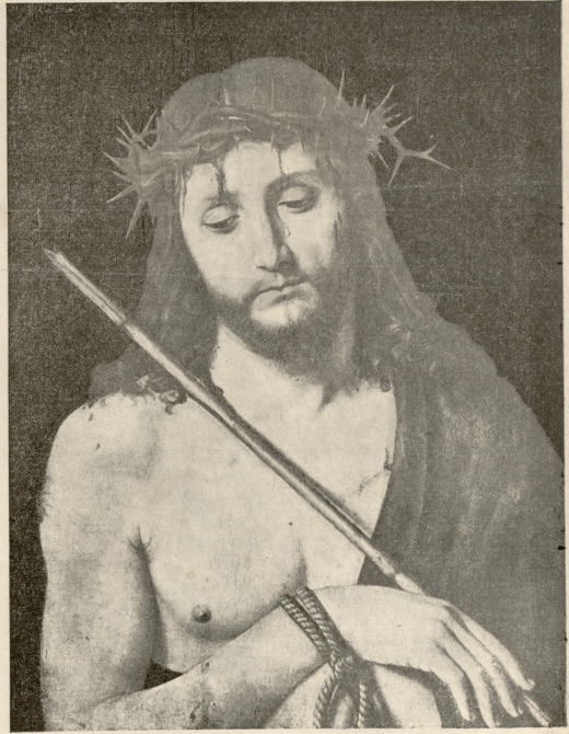
კელის გვირგვინი. — სურათი ანდრეს ბონინისა.

ვოკლერი კიდევ წამოვიდა, მღლა ამართა ხმლის წვე- რით თავისი ქალი და სთქვა: