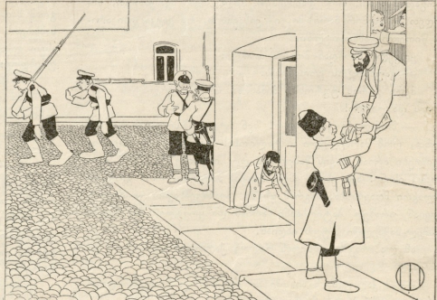
ვის უფრო სდევნიან შედგად?

ჰე მეგობრებო! ნეტამც გენახათ ის სურათი! დიდი და პატარა ალტაცებაში იყო, თვალგებზე ცრემ-