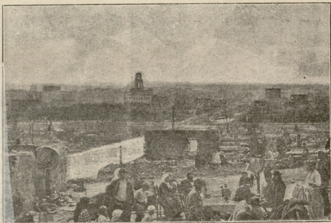
ერთი უბანი სიხრანის, ცეცხლის შერდვა.

შეცვლილი მთელი ჩემი ცხოვრება, სწორედ ისე მოვიტყე, როგორც ამ კაზებში სიტყვა: დავანებო თავი ცოლშვილზე ზრუნვას და მხოლოდ ჩემ სულზე ვიფიქრო. ტყუილად კი არა აქვს პავლე მოციქულს ნათქვამი: „ცოლიანი ცოლისათვის ზრუნვას, უცოლო კი ლეთისთვისა“.