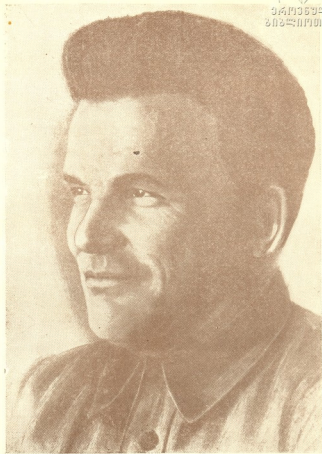
ს. ა. კობახიძე