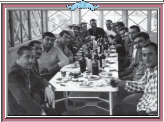
ქვემოთ პირველში (მარცხნივ მჯდომი) და თანამდებრივად (მარჯვნივ მჯდომი) ნადავლად შეიკრებიან „ნადავლადელების“ აღმშენებელი გენერალი ვახტანგ გიგინეიძე.