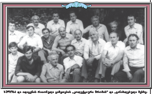
საქართველოს რაიონული ადმინისტრაციის "კულტურული მემკვიდრეობის დაცვის განყოფილებაში" და "კანადა-საქართველო მეგობრობის საზოგადოებაში" ადგილობრივი წევრების შეხვედრა.