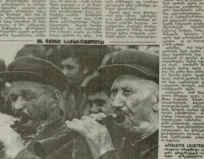
სიბერე ჭირს სიბერემ...