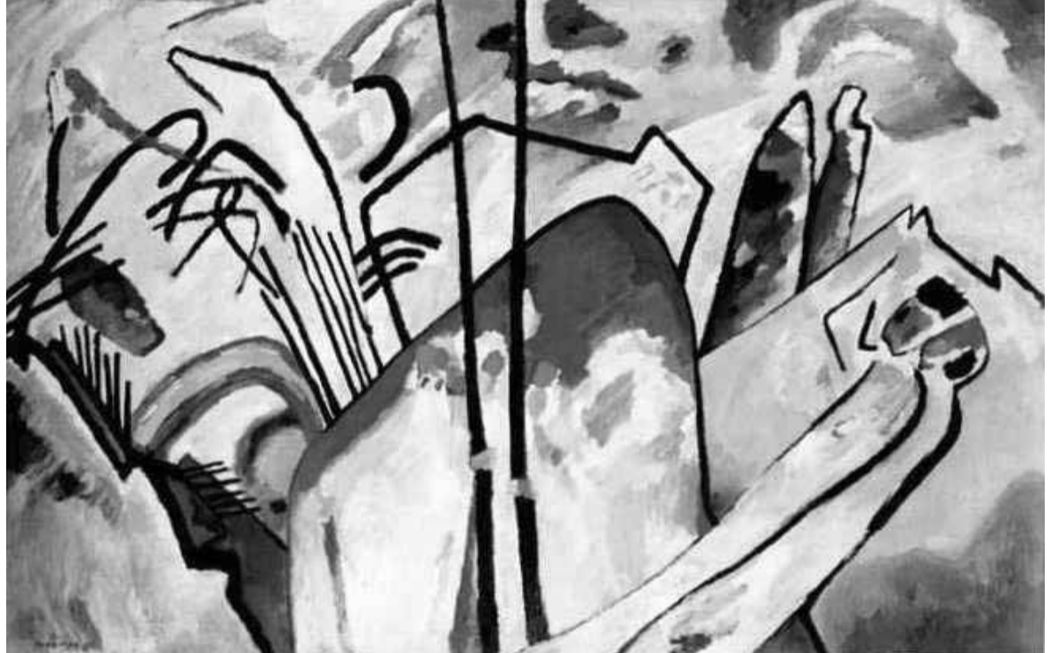
ვასილი კანდინსკი, „კომპოზიცია“

როვნულ განცდათა გამოხატვა და გარესამყაროს ზეგავლენის უგულებელყოფა. ეს კონტრასტი სრულიად ცხადად არის გამოვლენილი თავად ტერმინებში: „იმპრესიონი“ ფრანგულად შთაბეჭდილებას ნიშნავს და ეს მიმდინარეობაც შთაბეჭდილებათა ფიქსირებაზეა ორიენტირებული; „ექსპრესიონი“ კი გამოსახვას ნიშნავს და ექსპრესიონიზმშიც მიზნად ისახავს, დააფიქსიროს არა გარესამყაროს ზეგავლენა პიროვნების სულიერ და ემოციურ სამყაროზე, არამედ ხელოვნების შინაგანი სამყაროს ზეგავლენა გარესამყაროზე. ექსპრესიონისტული აღქმა მართლაც კონცენტრირებულია პიროვნების ირგვლივ. სამყაროს ცენტრში დგას სუბიექტი, რომელიც ცდილობს, საკუთარი პიროვნული ნება გაიაზროს, როგორც ერთადერთი ფასეულობა, ერთადერთი ჭეშმარიტება. მაგრამ ხშირად ამგვარი პიროვნული თვითკონცენტრაცია ერთგვარ აგრესიასაც კი იწვევს გარესამყაროსადმი. საზოგადოდ ექსპრესიონიზმი უარყოფს ინდივიდისა და გარესამყაროს თანხმობის იმპრესიონისტულ პრინციპს, რამდენადაც ეს თანხმობა ამჯერად მხოლოდ ილუზიად აღიქმება. ამისდა საპირისპიროდ ექსპრესიონისტული მსოფლალქმა ცდილობს, წარმოაჩინოს და გაიციანობიეროს ის დისპარმონია, რომელსაც მოუცავს სამყარო. ექსპრესიონისტული ხელოვნება გამოხატავს პიროვნების პროტესტს დისპარმონიული, არსდარღვეული სამყაროსადმი. ის ამძაფრებს სუბიექტურ აღქმას სწორედ იმდენად, რამდენადაც ინდივიდის თვალთახედვა არის ერთადერთი კრიტერიუმი გარესამყაროს შინაგან წინააღმდეგობათა აღსაქმელად და გასაცნობიერებლად. სწორედ ამიტომ ექსპრესიონისტულ ხელოვნებაშიც შესაგრძობია ფორმათა დისპროპორცია (რეალური სამყაროს დეფორმაციის გამომსახველი) და მხატვრულ სახეთა კონტრასტულობა (სამყაროს წინააღმდეგობრიობის გამომსახველი).