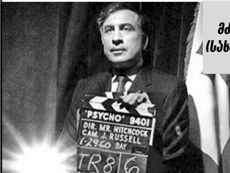
საქართველოში მკლავრობს ეშუენი (სახელად ვარდისფერი უიგუენი)...

ტარანტინო გადაფასდა... კრონენბერგს დაერხა... ვერხოვენი ჩამოინერა... მაღე ჰიჩკოკსაც გადაუჯოკრავენ... ③