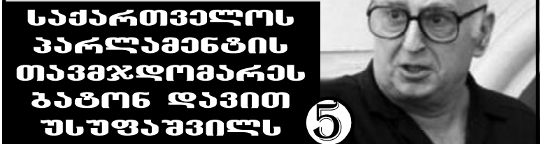
საქართველოს პარლამენტის თავმჯდომარეს ბატონ დავით უსუფაშვილს ⑤

რუსო აბაშუკელი: ქვეყნისთვის საჭირო აღამიანები საქართველოში უნდა დაბრუნდნენ!