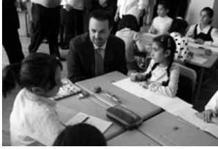
საქართველოს განათლებისა და მეცნიერების სამინისტრომ ძევერის სკოლას (ჯახალი მერხები, სასკოლო ავეჯი და 15 კომპიუტერი გადასცა.

სოფელ ძევერის საჯარო სკოლა გასული საუკუნის 40-იანი წლებიდან ფუნქციონირებს. რეაბილიტაციამდე შენობა სრულიად ამორტიზებული იყო. აღდგენითი სამუშაოების შედეგად სკოლაში გამოიცვალა კარ-ფანჯარა, იატაკი, შეიღებდა კედლები, მოეწყობა სველი ნატილები, დამონტაჟდა თანამედროვე გათბობის სისტემა. ამერიკის მთავრობის მიერ დაფინანსებული პროგრამის ფარგლებში, სკოლას საკუთარი დენის წყარო აქვს, უახლესი მომავალი ძევერის სკოლის მოსწავლეებისთვის ხელმისაწვდომი იქნება ინტერნეტის.