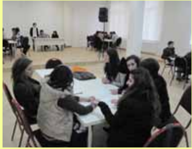
წარჩინებით კურსდამთავრებულთა დასაქმებაზე უნივერსიტეტი იზრუნებს