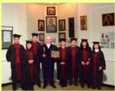
წარჩინებით კურსდამთავრებულთა გადაცემით ღვთისმეტყველების სახელობის მედალი