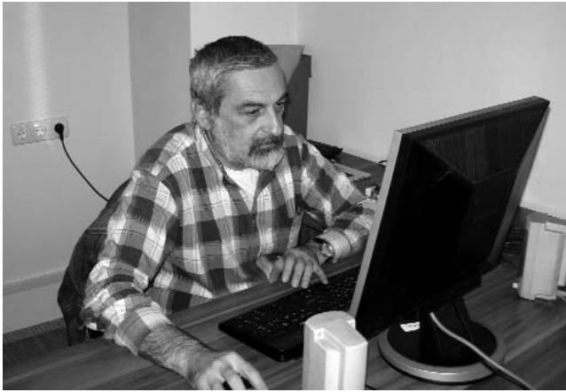
რამდენად საფუძვლიანია მწველვარება, რომელზეც საზოგადოება მოიცვა, თითქოსდა, სკოლებში ქართული ლიტერატურის შეფასების გამო. რა ცვლილება განიცდის ქართული ენისა და ლიტერატურის სავალდებულო გამოცდის ტესტმა?

მოგვხვდება, ქართული ენისა და ლიტერატურის ჯგუფი ერთიანი ეროვნული გამოცდებისათვის ორი ტიპის ტესტს ამზადებს – სავალდებულო სავალდებულო ტესტს და არჩევითი ლიტერატურის ტესტს. რაც შეეხება ლიტერატურის არჩევითი გამოცდის ტესტს, არაერთი ცვლილება არ იცვლება, როგორც იყო შარშან, იმგვარივე დარჩება, ანუ იქნება განსხვავებული ტიპის ორი წერიტი დაავალდება, რომლებიც 50 ქულას მოიცავს. 25 ქულით შეფასდება ერთი წერიტი დაავალდება, მეორეც – 25 ქულით. 30 ქულით შეფასდება ლიტერატურის ცოდნა – გარკვეული ეპიზოდების ანალიზისა და კრიტიკული აზროვნე-