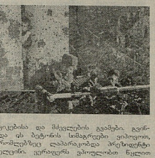
მედიუმიანი კონსტრუქტორი №13