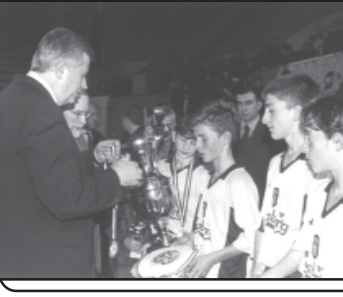
ბრეზიდენტის თასის თბილისში დარჩა

ბრეზიდენტის თასი თბილისში დარჩა. თბილისში დარჩა.