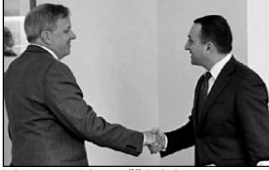
სებულის ვითარება და აშშ-საქართველოს სტრატეგიული პარტნიორობის საკითხები განიხილეს. საუბრისას კიდევ ერთხელ გაეცა ხაზი ორი ქვეყნის მეგობრულ

ურთიერთობებს და მჭიდრო თანამშრომლობას. ამჟამად კონტექსტში აღინიშნა ამერიკის შეერთებულ შტატებში საქართველოს საგარეო საქმეთა მინისტრის გიორგი კვიციანიშვილის ვიზიტის მნიშვნელობა, რომელიც აშშ-საქართველოს სტრატეგიული პარტნიორობის ქარტიის შესახებ შეხვედრაში მიიღებს მონაწილეობას.