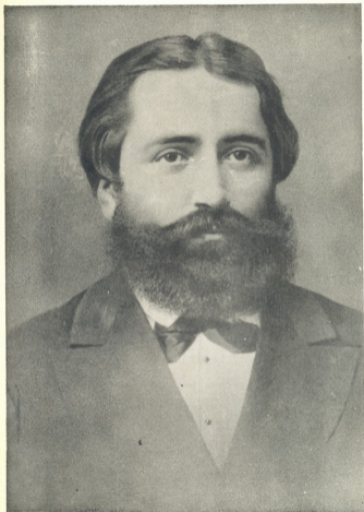
ილია ტვაეცკოვსკი — 1874 წელი