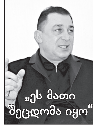
„ეს მათი შეცდომა იყო“

ვფიქრობ, პროკურატურის სისტემის სრული რეფორმაცია ჯერ კი-