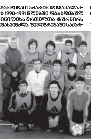
ბათუმის ფეხბურთის სატრენინგო ცენტრი...