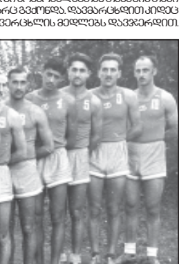
სტრენის გოგონები, დიდი სარგებლობა მოუპოვებენ...