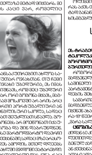
„მინიშე კოშმარს გამოექცა“. მისი დანიშნულება არის...